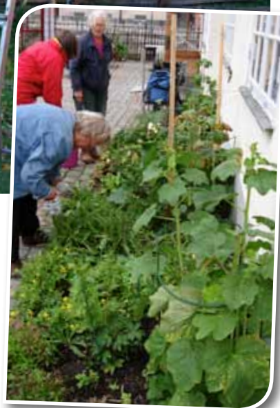
Linnérabatten vid Upplandsmuseet sköts av Sällskapets medlemmar.