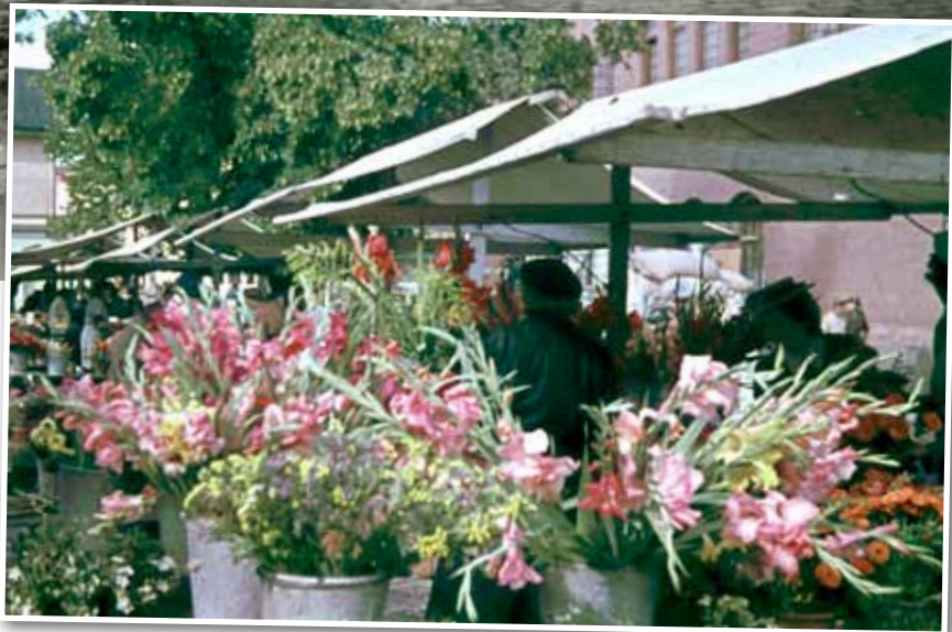
Torghandel, St Eriks torg på tidigt 1900-tal.