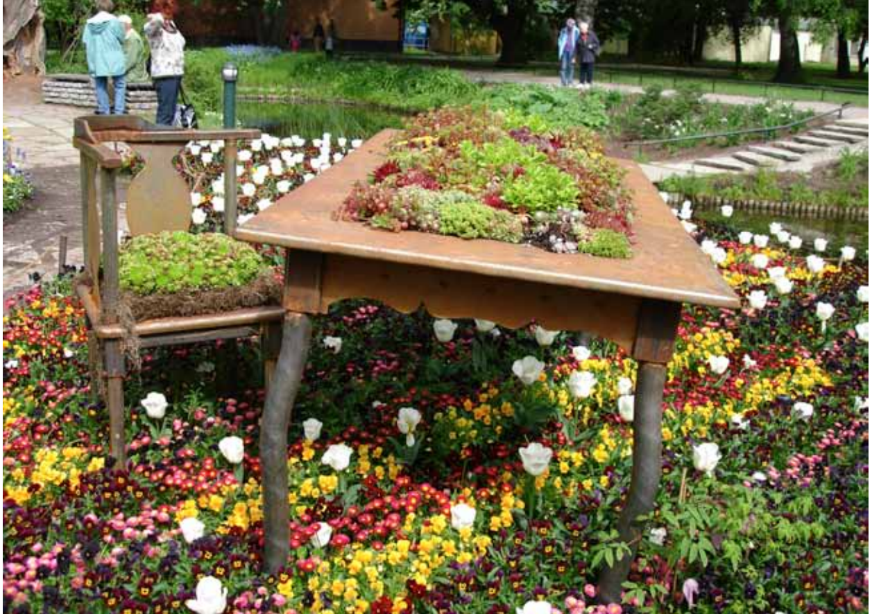
Linnés skrivbord på Lycksalighetens ö i Stadsträdgården. Jubileumsåret för Linné 2007.