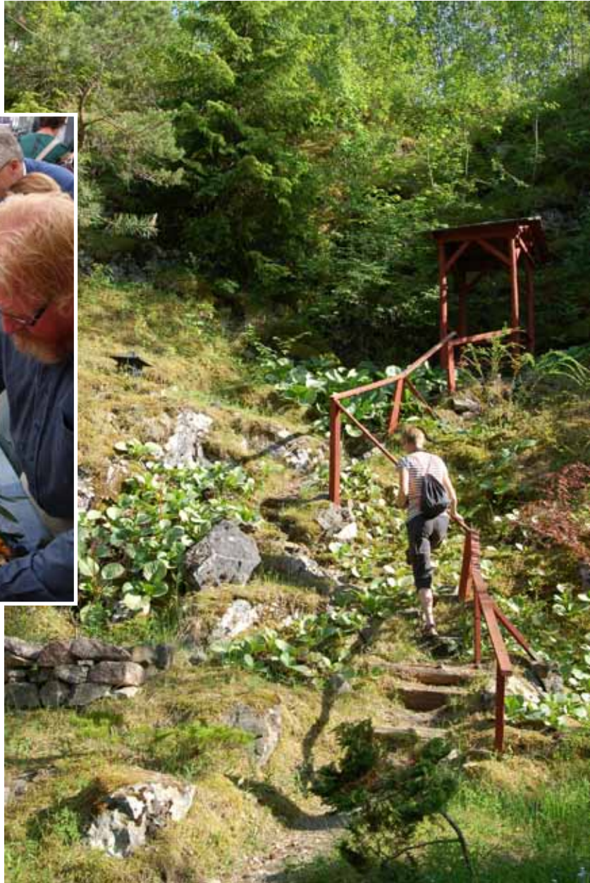
Föreningens resa 2011 till bl a Bastedalens Kinapark.