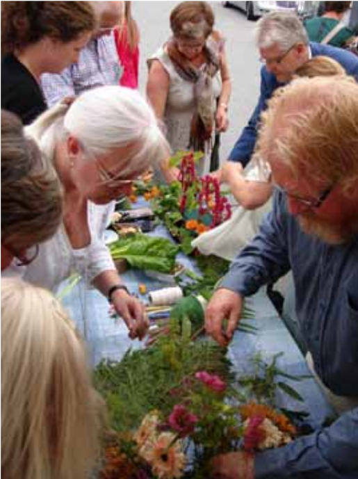
Sommarmötet i Kungsbacka 2011.